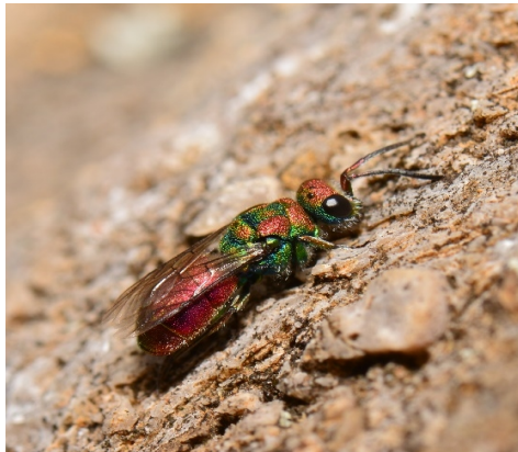
Chrysura hybrida, l'un des insectes menacés vivant sur l'ancienne carrière.

Ce site est l'héritage de l'exploitation du calcaire et présente aujourd'hui un intérêt écologique très important. En effet, bien qu'il s'agisse d'un milieu fortement marqué par l'Homme, la nature n'est jamais bien loin et elle a rapidement repris ses droits suite à l'arrêt de l'activité. L'originalité de cette zone tient dans son relief particulièrement accidenté et son sol calcaire qui, couplés à un ensoleillement favorable (sud), permettent l'existence de milieux dit thermophiles, c'est-à-dire chauds et secs, voire même arides. La géologie est également remarquable avec la présence de calcaires à entroques ( petits fossiles témoins de l'existence d'un ancien océan il y a des millions d'années ).