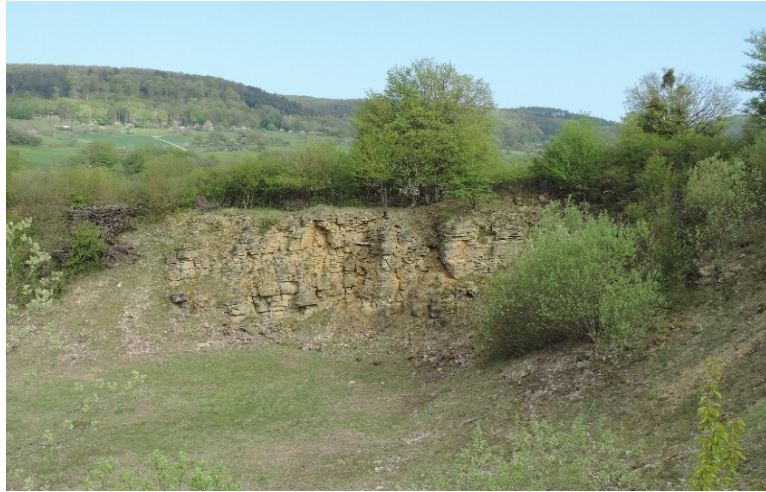
Vue sur un ancien front de taille et sur la pelouse sèche centrale du site.

L'ancienne carrière de Lembach, située au sud de la commune, a été acquise fin 2018 par le Conservatoire d'espaces naturels d'Alsace , association reconnue d'utilité publique pour la préservation des espaces naturels en Alsace.